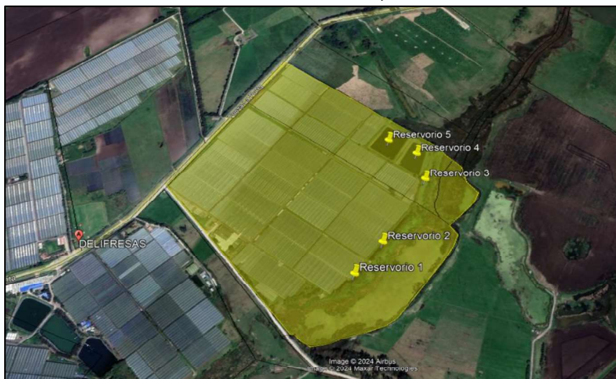
Ilustración 1. Ubicación predio

De acuerdo al asunto de referencia y teniendo en cuenta que el Honorable Concejo Municipal solicitó información a la Secretaría de Ambiente y Bienestar Animal por quejas interpuestas por la comunidad referente al riego de agua en vía pública por parte de la empresa Flores de los Andes – Finca Monteverde ubicada en el kilómetro 1 vía Funza – La Punta (polígono amarillo), vereda El Cacique, se realizó visitas técnicas los días 27 y 29 de febrero por parte del personal adscrito a esta secretaría de conformidad con las actas de visita ambiental No. 014 y 019.